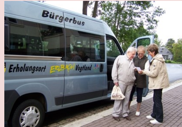
Anpassung an den Schrumpfungsprozess

Trendumkehr durch wirtschaftliches Wachstum