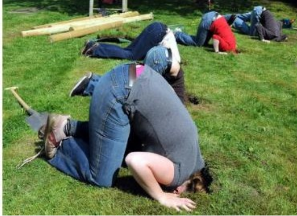
Ignorieren des demografischen Wandels