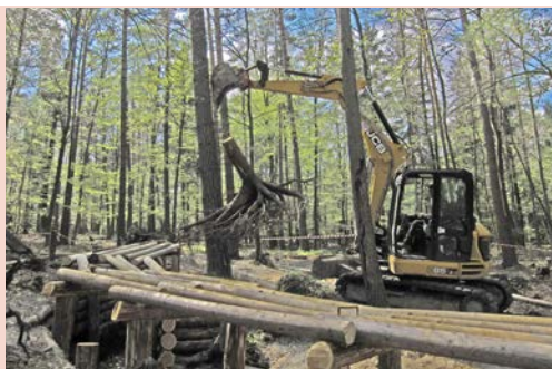
Im forstgeschichtlichen Freigelände (Waldhütte in Hinterhermsdorf) wird anhand konkreter Beispiele die Waldbewirtschaftung früher

Hilfreiche Informationen finden unter: www.nationalpark.ch/