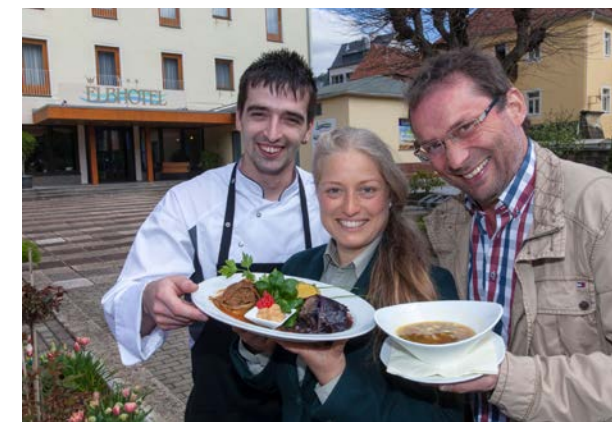
Bei der Zusammenstellung regionaler Gerichte ist bei uns Teamarbeit angesagt.