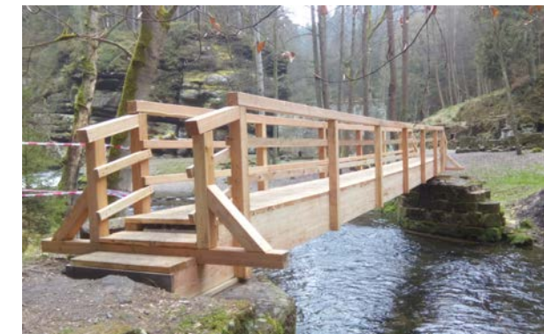
Solide Zimmermannsarbeit - die neue Grundmühlenbrücke über die Kamnitz

Die Brücke ist derzeit der einzige Verbindungsweg zwischen Hohenleipa und Zielen am linken Ufer der Kamnitz, d. h. Dittersbach (Jetřichovice), Kamnitzleiten (Kamenická Stráž), Rosendorf (Růžová), Rosenberg (Růžovský vrch), bzw. auch Windischkamnitz (Srbská Kamenice). Der gelb markierte Wanderweg am rechten Ufer der Kamnitz in Richtung Dittersbach ist