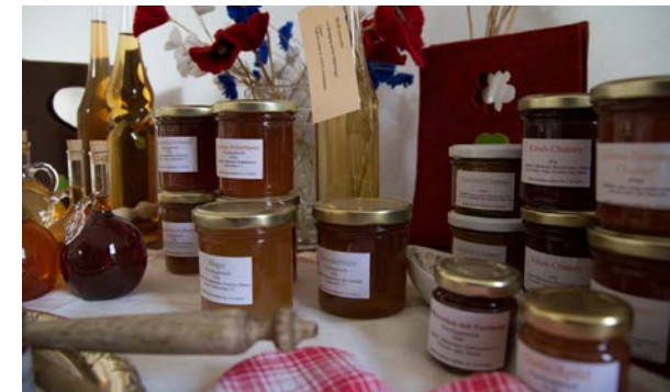
Ein Besuch lohnt sich immer im Maienhof. Bringen Sie etwas Zeit mit, um das Ambiente zu genießen.