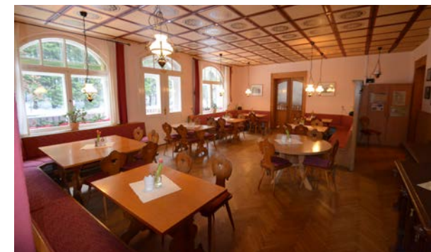
Der helle und freundliche Gastraum wird dem Baudencharakter voll gerecht.

Nicht erst seit dem wird der Fokus stärker auf die Verwendung von regionalen Produkten gesetzt. Ganz besonders von den Pensionsgästen der Schrammsteinbaude wird geschätzt, wenn sie sich zum Frühstück mit frischen Biobrötchen von der Bäckerei Förster aus Bad Schandau, regionalem Honig, Käse vom Bauernhof Steinert und Ziegenhof Lauterbach für die Wanderungen im Nationalpark stärken können.