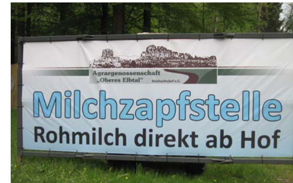
Die „Milchtankstelle“ befindet sich direkt auf dem Betriebshof in Reinhardtsdorf und ist täglich geöffnet.