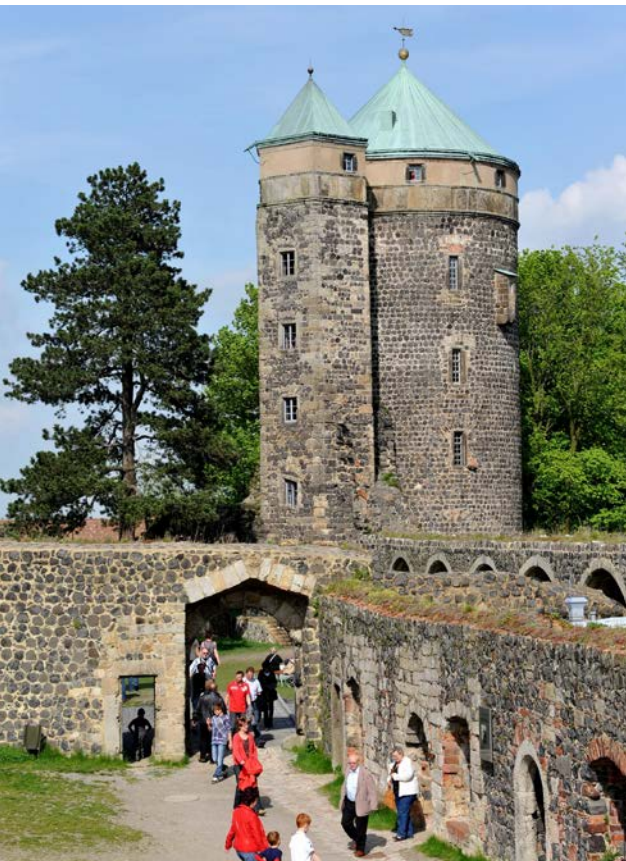
Der Coselturm ist schon vom Weitem als Wahrzeichen der Burgstadt zu erkennen.

Die Gräfin Cosel verstand sich als hochadelige Standesperson, als die Frau des Königs. Zum fürstlichen Selbstverständnis und Repräsentieren gehörte eine abwechslungsreiche und üppig gefüllte Tafel. Alle Speisen wurden gleichzeitig aufgetragen. August der Starke ließ der von ihm angebeteten Freifrau von Hoym, der späteren Gräfin Cosel, fürstliche Aufmerksamkeiten zukommen. Im lau-