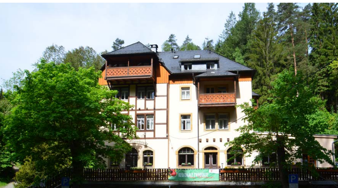
Die Schrammsteinbaude im Zahnsgrund ist auch gut mit dem Wanderbus 252 erreichbar.

Seit März 2015 können in der Gaststätte und Pension Schrammsteinbaude auch regionale Produkte zum Mitnehmen von den Gästen erworben werden. Der Start war etwas zögerlich, aber nun wird dieses Angebot gut genutzt. Besonders der Honig von der Imkerei Schmidt aus Dippoldiswalde und die Nudeln von Pasta-Lucia sind gefragt. Aber auch das Wein- und Saftangebot von Gut Pesterwitz und die Spirituosen von der Altenberger Likörfabrik werden gut angenommen.