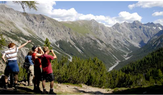
Das Engadin ist der einzige Schweizer Nationalpark. 2015 feierte man das 100-jährige Bestehen.