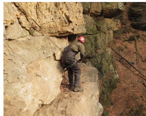
Mitarbeiter der Felsenmannschaft bringen instabile Steinblöcke kontrolliert zum Sturz.

Die Mitarbeiter der Felsenmannschaft der Nationalparkverwaltung Böhmisches Schweiz brauchten nur wenig Kraft, um die Steine in Bewegung zu setzen. Die auf den Wanderweg gefallenen Brocken wurden zur Seite geräumt und verbleiben vor Ort. Den Wanderweg durch die Edmundsklamm begehen jährlich mehr als 150.000 Besucher. ■