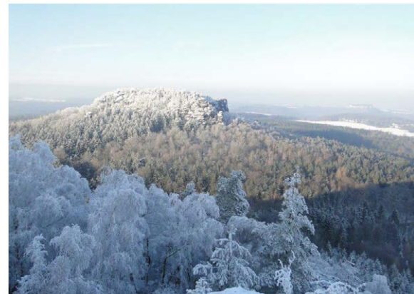
Eine Einmaligkeit für diesen Winter – weiße Felsenwelt am Papstein im Februar 2014

Grandiose Aussicht und frisches Fleisch, Fahrtziel Natur und regionale Denker, Kirche am Nationalpark und neue Bilder, Zeitengang und eigener Käse, Hochwasserspende und Bergsteigerjubiläum