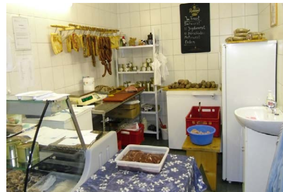
Blick in die kleine Ladentheke