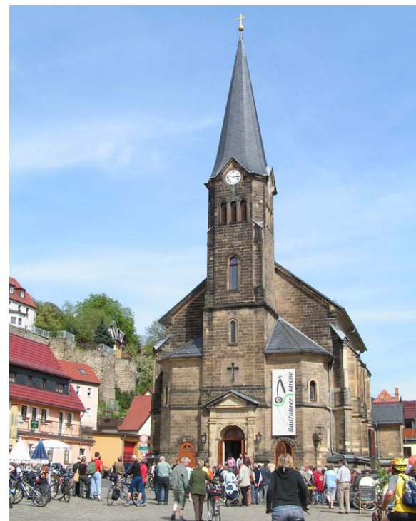
Die Radfahrerkerche in Stadt Wehlen

Radfahrerkerche Stadt Wehlen, Fährweg 1, 01829 Stadt Wehlen, Tel. 03501/588032, kg.lohmen@evlks.de , www.radfahrerkerche-wehlen.de