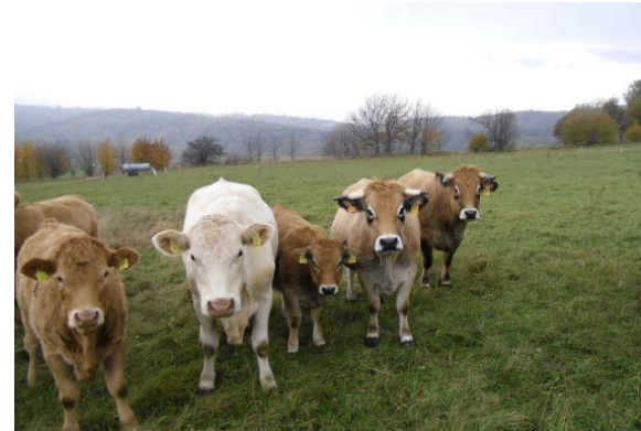
Schon fast im Osterzgebirge weiden die Rinder der Familie Steudtner.

22.03. und 10.05.2014 Fleisch und Wurst vom Schwein 05.04.2014 Fleisch und Wurst vom Rind ■