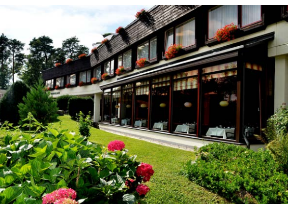
Berghotel Bastei – mitten im Nationalpark Sächsische Schweiz