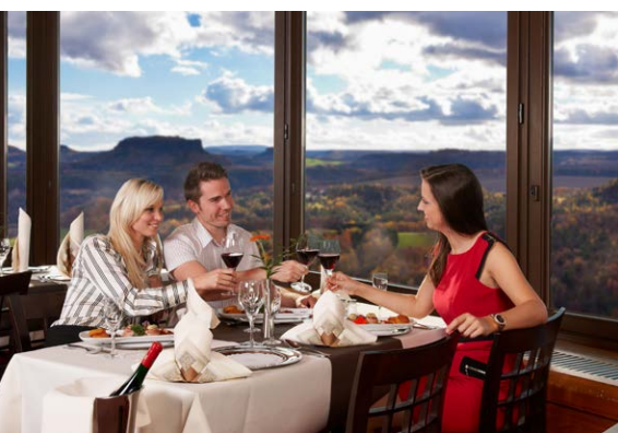
Panoramarestaurant mit einzigartigem Blick über das Elbtal