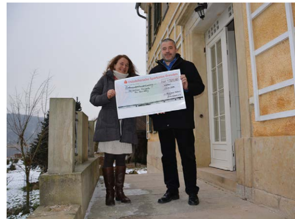
Scheckübergabe am Herrenhaus Orangella an der Elbe

Das Herrenhaus Orangella freut sich auf die Saison 2014 und heißt seine Gäste herzlich willkommen. ■