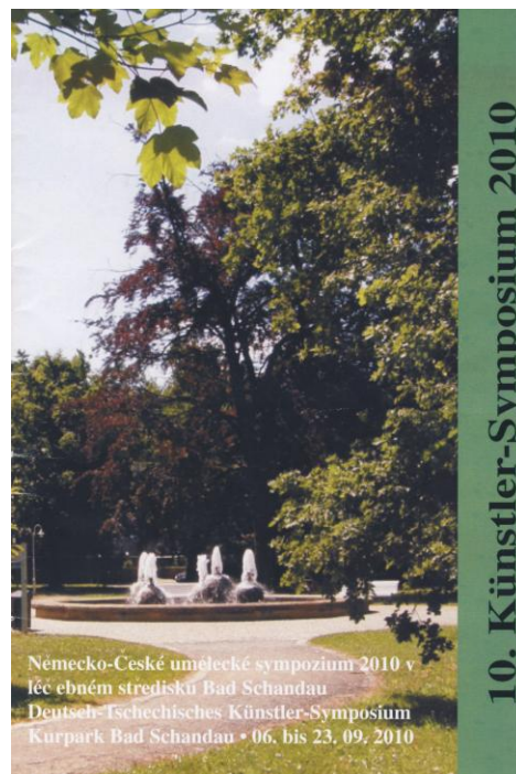
Německo-České umělecké sympozium 2010 v léčebném středisku Bad Schandau Deutsch- Tschechisches Künstler-Symposium Kurpark Bad Schandau • 06. bis 23. 09. 2010

23.09.2010 bylo sympozium na místě konání slavnostně ukončeno.