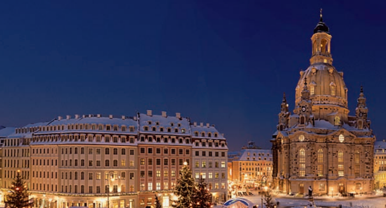
Advent na náměstí Neumarkt