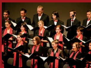
Drážďanský komorní sbor