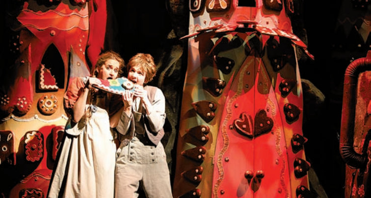
Jeníček a Mařenka