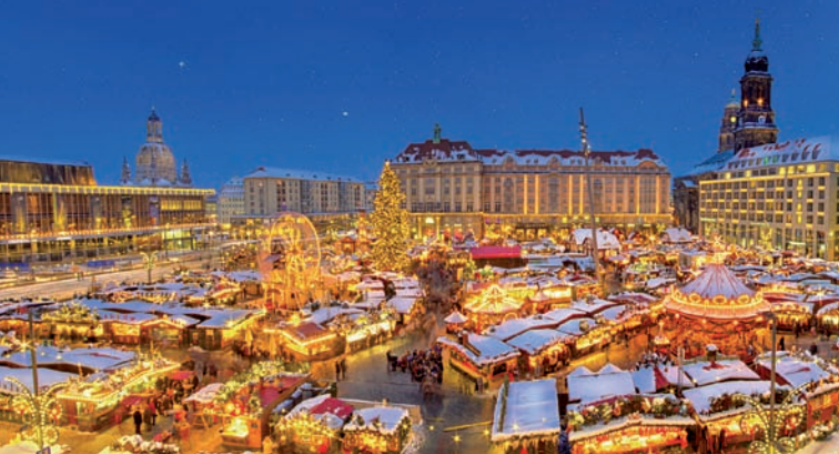
Vánoční trh Striezelmarkt