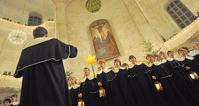
Vánoční mše se sborem Dresdner Kreuzchor